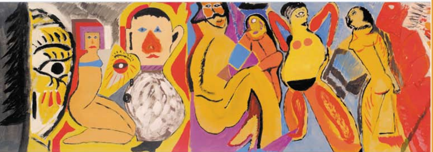
OBRA PERTENECIENTE AL TALLER DE ARTE DE FUNDACION SAVIA